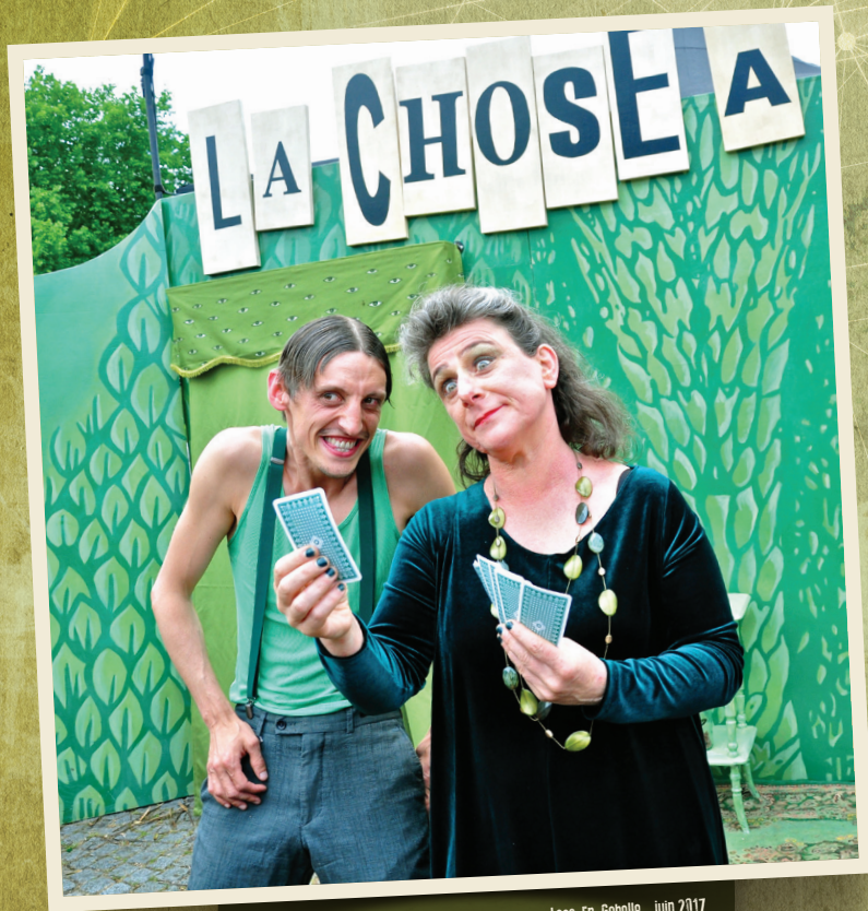
Festival La Constellation Imaginaire Culture Commune - Loos-En-Gohelle - juin 2017

Mesdames et messieurs, Voici venu le temps d'affronter votre heure de vérité !